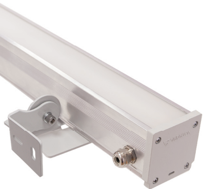
ДБУ49-40-003 Wall Line 740