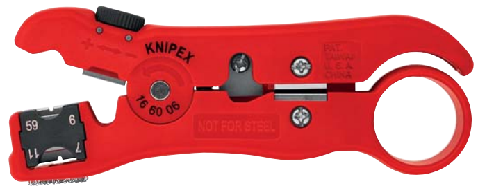
16 60 06 SB МММ