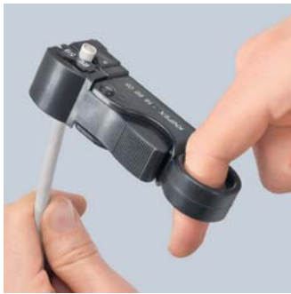
Трехступенчатый рез в один рабочий ход