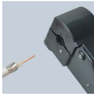
Внутренние слои освобождаются отдельно