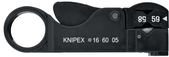
16 60 05 SB МММ