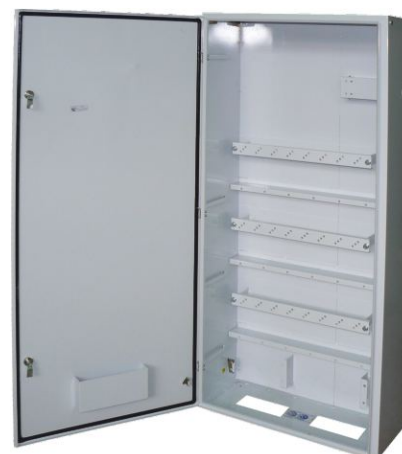
Корпус ШРС-1-7 IP54