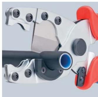
Многослойные трубы Ø 12 - 25 мм режутся чисто и без деформации