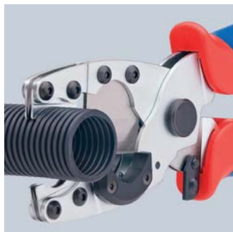
Чистое резание защитных труб Ø 18 - 35 мм