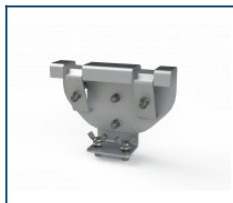
Кронштейн на трос Unit (комплект)