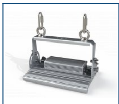
Крепление Рым-болт М6 Unit (комплект)