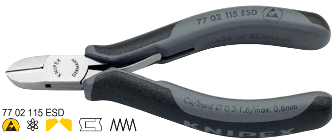
77 02 115 ESD

острая головка типа «мини», с маленькой фаской; твердость режущих кромок примерно 60 HRC