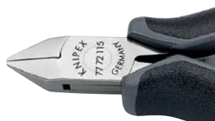
77 72 115 ESD