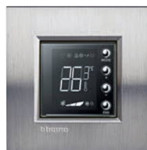
LN4691 + рамка, фактурная сталь, LNA4802ACS