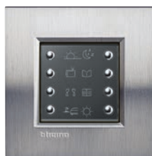
LN4652 + рамка, фактурная сталь, LNA4802ACS