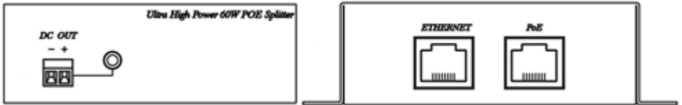
Рис.2 Разъемы и индикаторы IP06S60-24