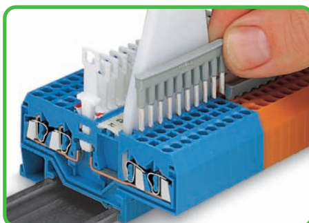
Клеммы с размыкателями для тестирования и измерений 10-кан. гребешковая перемычка