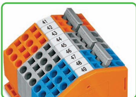
4-проводные проходные клеммы, углового исполнения Образуют группы с 3-кан. гребешковыми перемычками