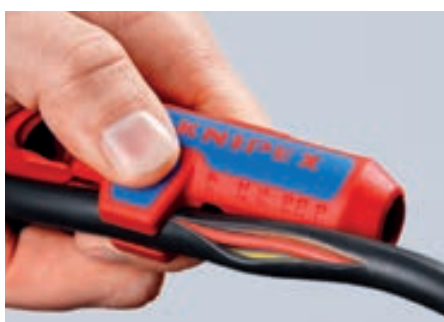
С лезвием для удобного продольного реза, скрытым в выступающем блоке с упором под большой палец