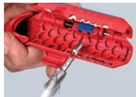
Удаление изоляции с коаксиального кабеля