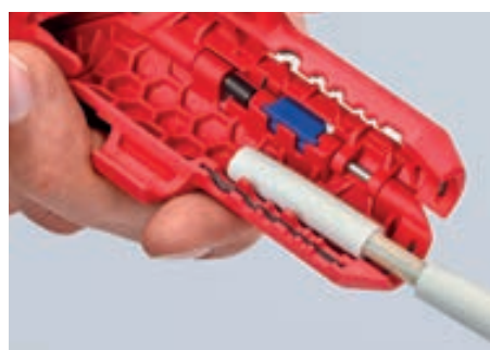
Удаление оболочки с провода NYM