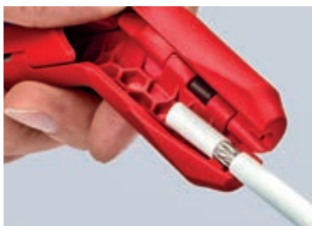
Удаление оболочки с коаксиального кабеля