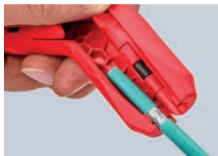
Удаление оболочки с дата-кабеля