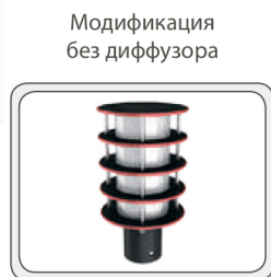
Модификация без диффузора