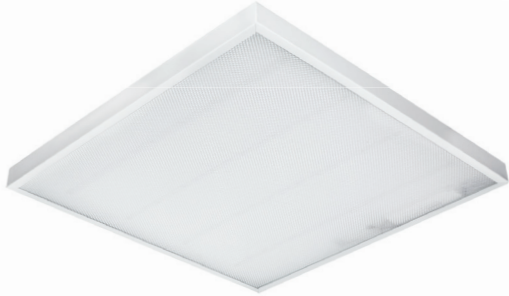
СВЕТИЛЬНИКИ С БАП