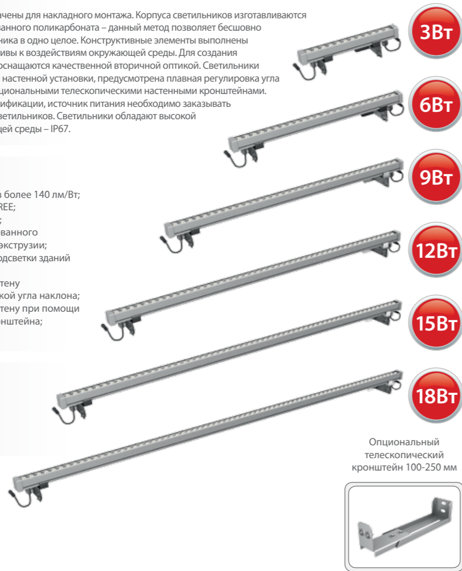
Оptionальный телескопический кронштейн 100-250 мм