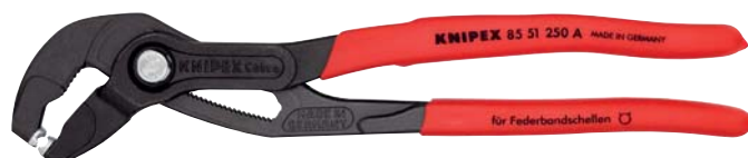
85 51 250 A