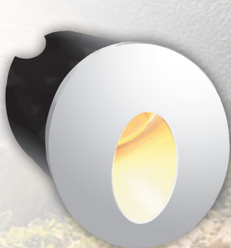
PWS/R R5060 2w