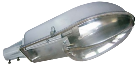
РКУ, ЖКУ, ГКУ Серия 45 “Форвард 2”