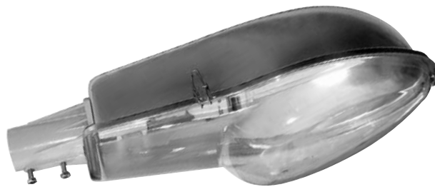
ЛКУ Серия 44 “Форвард 1”, 45 “Форвард 2”