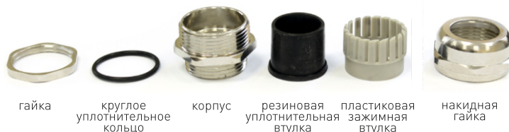
гайка круглое уплотнительное кольцо корпус резиновая уплотнительная втулка пластиковая зажимная втулка накидная гайка