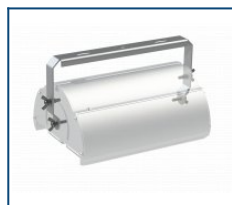
Кронштейн лира Angar 60 (комплект)