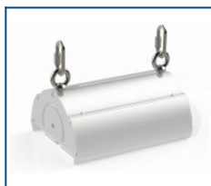
Кронштейн рым-гайки Angar (комплект)