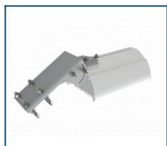
Кронштейн консоль поворотная Piton/Angar (комплект)