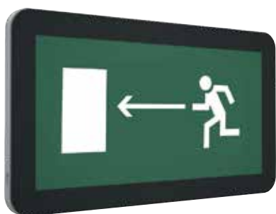
I-BRILL 4021-6 LED BL