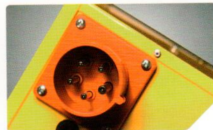
Трёхфазная вилка на корпусе (в моделях на 9 и 15 кВт)