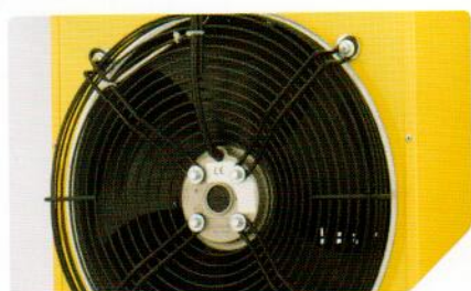
Мощный промышленный пылевлагозащищенный вентилятор с увеличенным ресурсом работы