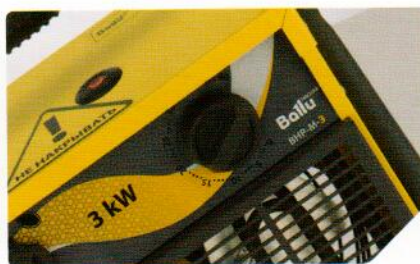
Высокоточный капиллярный термостат 0...+40 °С из нержавеющей стали и кнопка перезапуска защитного термостата