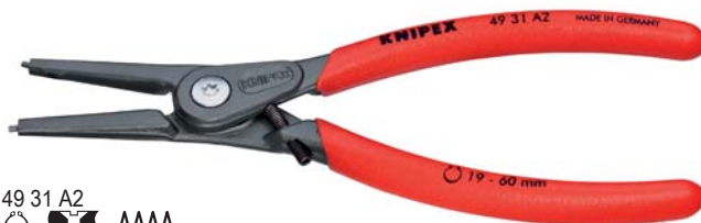
49 31 A2 ○