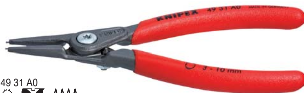
49 31 A0 ○

Форма 4: DIN 5254 B; наконечники изогнуты под углом 90°