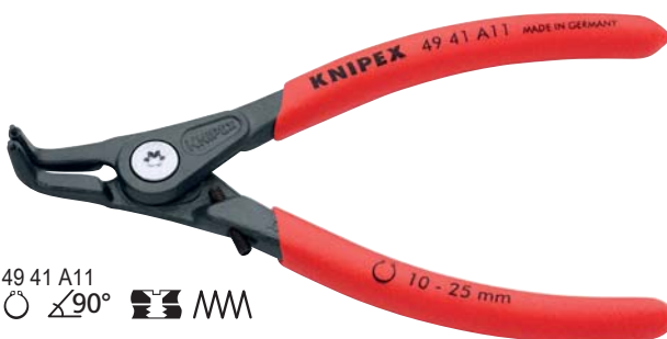
49 41 A11 ○ \angle 90^\circ

KNIPEX щипцы для стопорных колец с ограничением раскрытия Для применения в серийной сборке чувствительных узлов и механизмов, где нужно соблюдать нормативы DIN 471 и 472. Щипцы для стопорных колец с ограничением раскрытия выполняют эти требования и обеспечивают долгий срок службы.