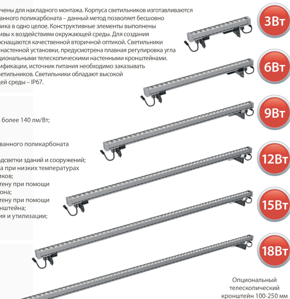
Оptionальный телескопический кронштейн 100-250 мм