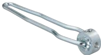
Монтажный инструмент HED