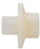
BUM – Гайка с фланцем