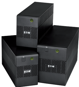
ИБП серии 5E