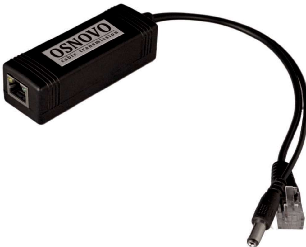
Рис.1 PoE Splitter/3, внешний вид