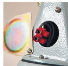
Клемма подключения питания