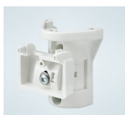
FA-3 Универсальный настенно-потолочный кронштейн