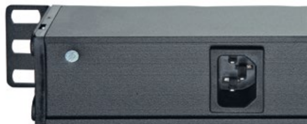
ВХОД ДЛЯ БЛОКОВ 60А-61-02-07ВL И 60А-61-04-08ВL РЕАЛИЗОВАН НА ОСНОВЕ РАЗЪЕМА С14. ШНУР ПОСТАВЛЯЕТСЯ ОТДЕЛЬНО