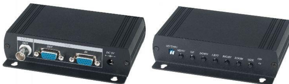
Рис.1 Внешний вид