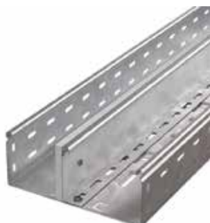
Вертикальный монтаж перегородки DD к разделительной металлической перегородке SEP