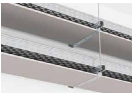
Горизонтальная установка перегородки DD держателями серии ВМЗ-15