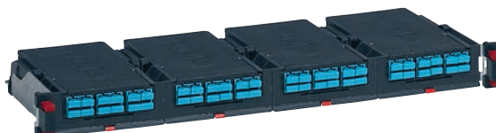
В патч-панель 0 321 40 устанавливается 4 кассеты 0 321 43