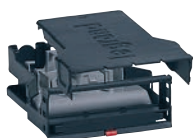
0 321 41