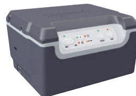
0 322 00