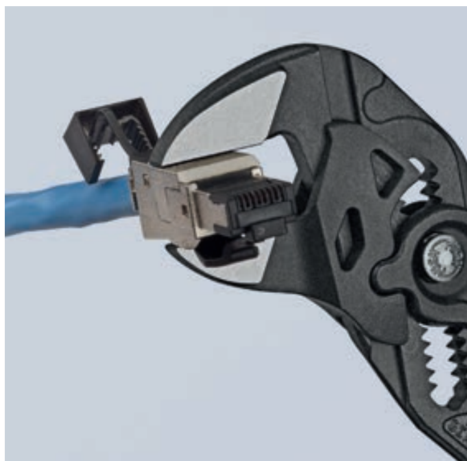
Допустима параллельная опрессовка — на примере корпуса разъема: