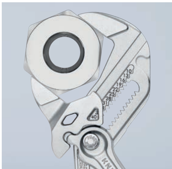
Аккуратная работа с деталями, имеющими чувствительную поверхность

Диапазон захвата увеличен с 35 мм до 40 мм