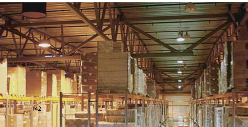
г. Санкт-Петербург, склад Nordway