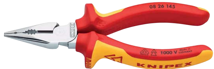
08 26 145 1000 V