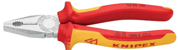
03 06 180 1000 V