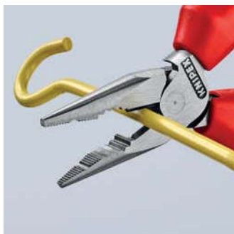
Лёгкое резание благодаря эффективному шарниру с высокой передачей усилия