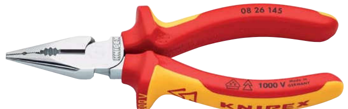
08 26 145 ⚡ 1000 V