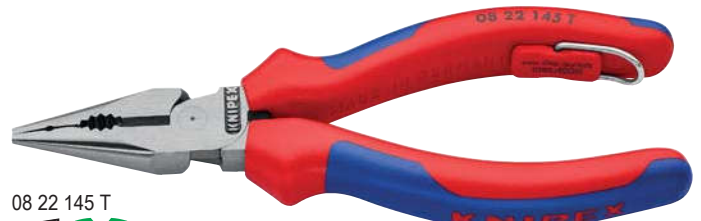
08 22 145 T