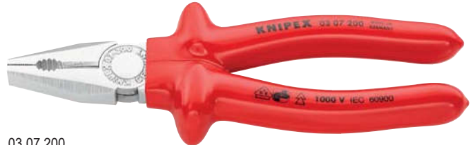
03 07 200 1000 V