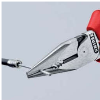
Фрезерованная канавка в зоне раствора

08 22 145 T : инструмент с креплением для страховки от падения с высоты