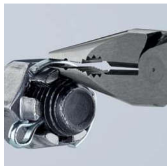
Наконечник сохраняет свою жёсткость даже под большими нагрузками