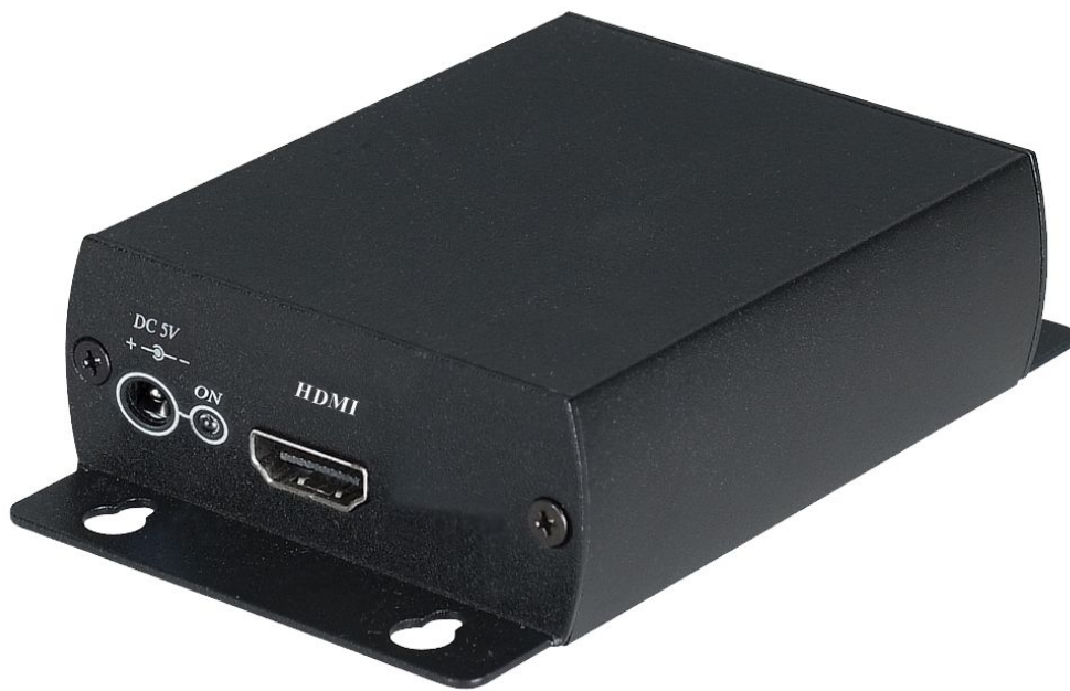
Рис.2 Вид сзади SDI01.