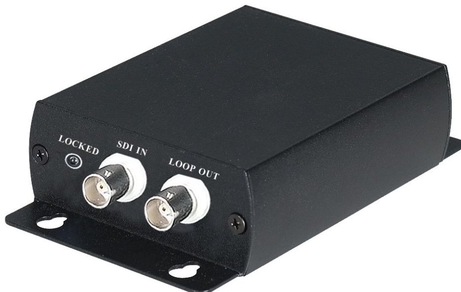
Рис.1 Вид спереди SDI01 .