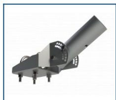
Кронштейн поворотная консоль (-20 до 75) (комплект)