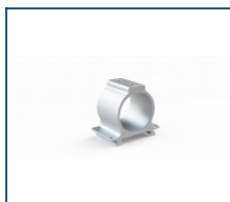
Консольный кронштейн Unit (комплект)