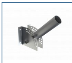
Настенный кронштейн для консольного крепления с регулировкой угла наклона