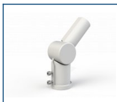
Кронштейн поворотный 90 град. Caiman / Unit