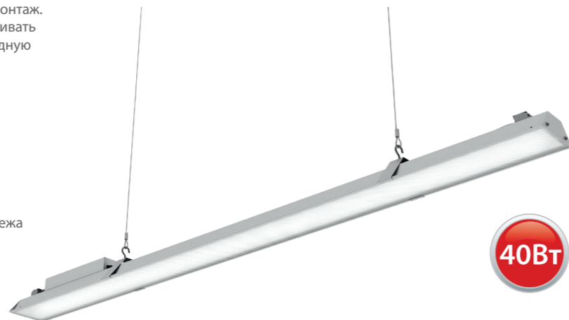
Установка светильников в одну линию