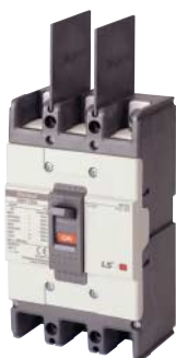
Межполюсные перегородки для выводов, к которым подключается питание, входят в комплект поставки.