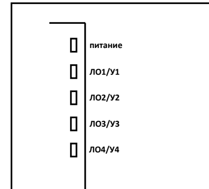
Рисунок-2 Схема клемм подключения и выбора варианта включения БКЛО