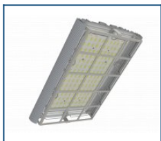
Решётка защитная Unit/Angar D60