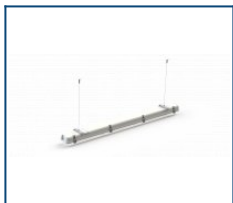
Тросовый подвес для LPO/LSP (комплект, 1 м)