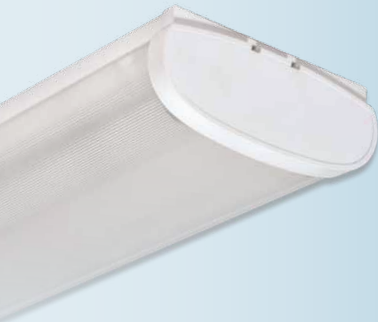
Электронный ПРА Philips