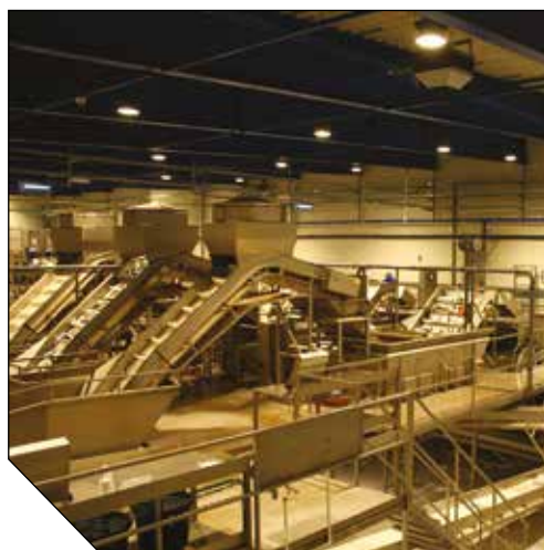
LODESTAR LED D120