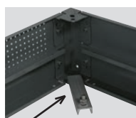
0 345 49