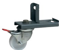
0 477 00