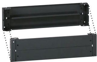
Кат. № 0 476 67 состоит из 4 углов и пластин для монтажа сзади