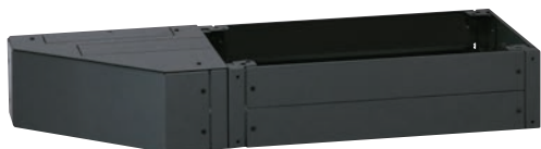
Комплект 0 476 67 с вентиляционной пластиной 0 476 63 и приспособлением для сопряжения 0 477 05