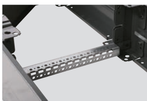
0 476 92 с сетчатым кабелепроводом