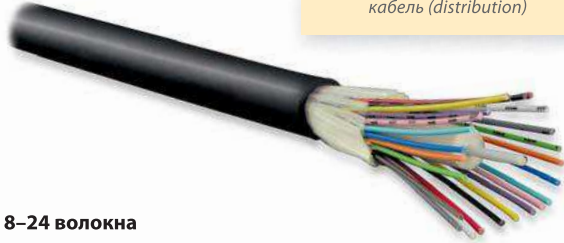
Обычный распределительный кабель (distribution)