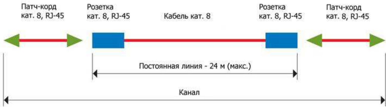
Иллюстрация конфигурации канала категории 8