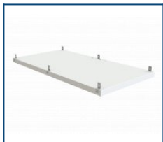
Комплект подвесов для Office Max