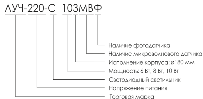
Рис.1. Расшифровка наименования изделия.

В зависимости от модификации, светильники с фотодатчиком и микроволновым датчиком движения выпускаются мощностью 6, 8 и 10 Вт. Расшифровка наименования изделия приведена на рис.1.