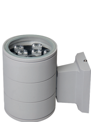
PWL-145110/24D 1x9w 6500K GR