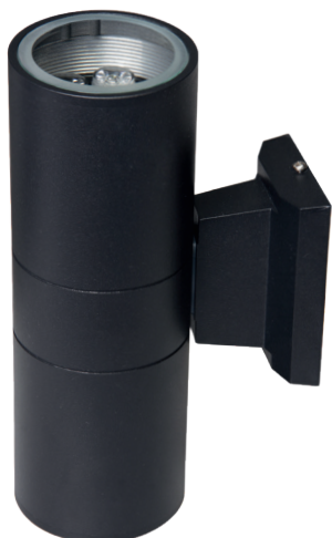
PWL-26090/24D 2x5w 6500K BL