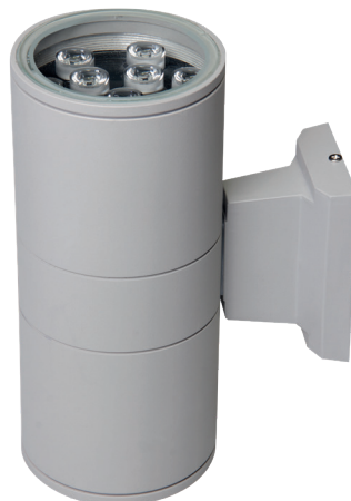
PWL-245110/24D 2x9w 6500K GR