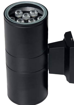
PWL-245110/24D 2x12w 6500K BL

Светодиодные светильники направленного света PWL jazzway используются для декоративно-архитектурного оформления элементов фасадов зданий, колонных элементов, стен и межоконных пространств. Светильники отличаются современным универсальным дизайном.