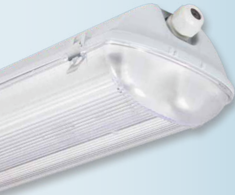
Монтажная скоба из нержавеющей стали